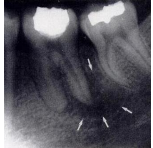
Cómo se ve un absceso dental en una radiografía dental

Si experimenta alguno de los síntomas anteriores, debe programar una cita con su dentista de inmediato. Su dentista examinará sus dientes y puede tomar una radiografía para determinar el alcance del problema de la pulpa dental. Si la pulpa dental está infectada o inflamada, su dentista puede recomendar un tratamiento de endodoncia.