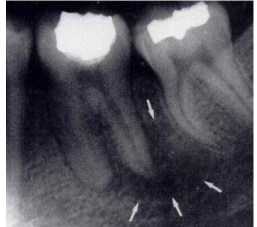
牙齿脓肿在牙科 X 射线上的外观

如果您遇到上述任何症状，您应该立即与您的牙医预约。您的牙医将检查您的牙齿，并可能拍摄 X 光片以确定牙髓问题的严重程度。如果牙髓感染或发炎，牙医可能会建议进行牙髓治疗。