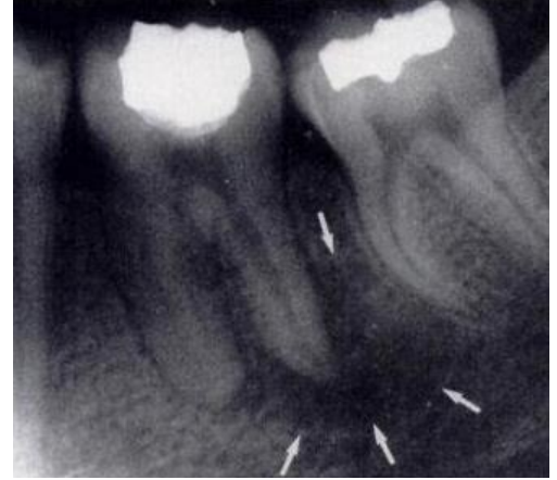
كيف يبدو خراج الأسنان على الأشعة السينية للأسنان

إذا واجهت أيا من الأعراض المذكورة أعلاه ، فيجب عليك تحديد موعد مع طبيب أسنانك على الفور. سيقوم طبيب أسنانك بفحص أسنانك وقد يأخذ أشعة سينية لتحديد مدى مشكلة لب الأسنان. إذا كان لب الأسنان مصابا أو ملتهبا ، فقد يوصي طبيب أسنانك بالعلاج اللبي.