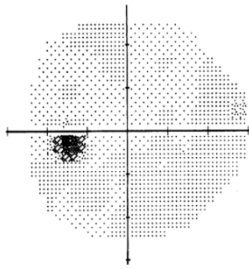
Visual field within normal limits