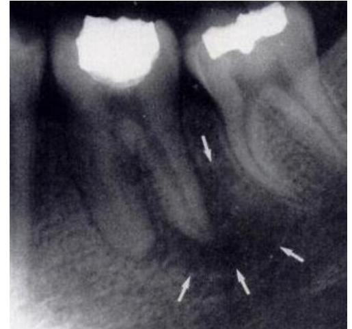
Paano ang hitsura ng isang abscess ng ngipin sa isang Dental X Ray

Kung nakakaranas ka ng alinman sa mga sintomas sa itaas, dapat kang mag iskedyul ng appointment sa iyong dentista kaagad. Ang iyong dentista ay susuriin ang iyong mga ngipin at maaaring kumuha ng X ray upang matukoy ang lawak ng problema sa pulp ng ngipin. Kung ang dental pulp ay nahawaan o inflamed, ang iyong dentista ay maaaring magrekomenda ng endodontic treatment.